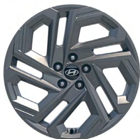
19" kola z lehké slitiny

www.porovnejhyundai.cz (Porovnejte si vozy Hyundai s konkurencí)