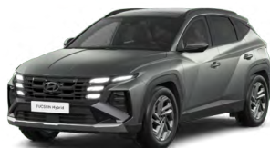
Pine Green Matt Matná Cena: 15 000 Kč