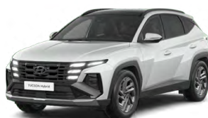
Serenity White Pearl Perleťová Cena: 0 Kč