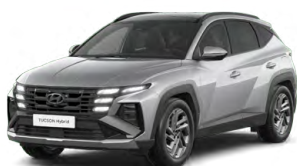
Shimmering Silver Metallic Metalická Cena: 0 Kč