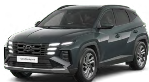
Cypress Green Pearl Perleťová Cena: 0 Kč