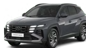
Ecotronic Gray Pearl Perleťová Cena: 0 Kč