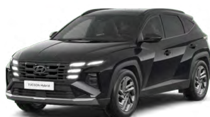
Abyss Black Pearl Perleťová Cena: 0 Kč