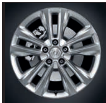
18" kola z lehké slitiny