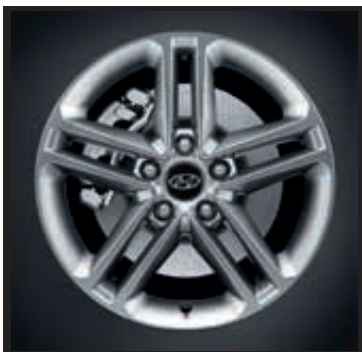
17" kola z lehké slitiny