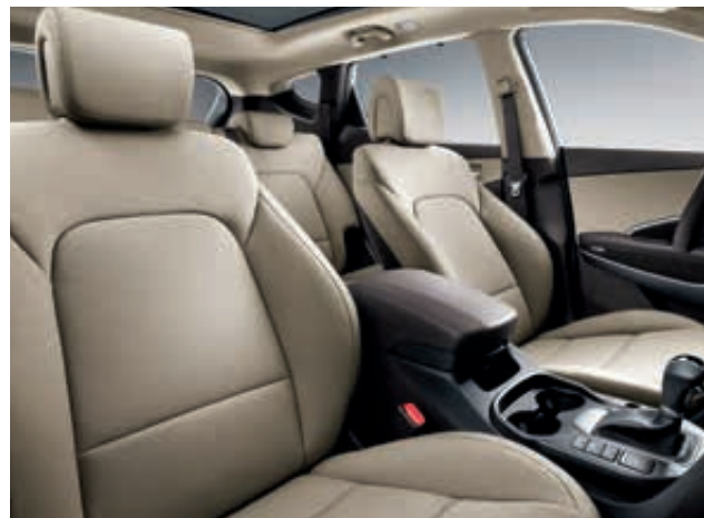
Běžový dvoutónový interiér (běžová/černá)