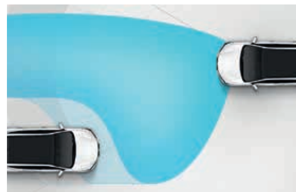
Automatické přepínání dálkových světel HBA (High Beam Assist). Jakmile jsou detekována protijedoucí vozidla, světlomety se automaticky přepnou z dálkových na tlumené, aby nedocházelo k oslňování ostatních řidičů.