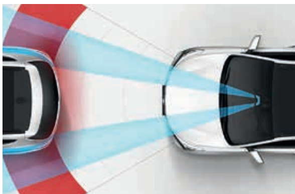
Autonomní nouzové brzdění AEB (Autonomous Emergency Braking). Radarové a kamerové senzory detekují riziko nehody, nejprve řidiče upozorní a v případě potřeby i samostatně zahájí brzdění, čímž se zabrání kolizi s chodcem či jiným vozidlem, nebo se alespoň zmírní její intenzita.

Vzhled nového modelu Santa Fe bezesporu vyvolává důvěru. A tento příslib je naplněn inteligentními technologiemi z oblasti aktivní bezpečnosti, které poskytují komplexní ochranu pro cestující i chodce. Důležitou součástí filozofie značky Hyundai je minimalizace rizik v každodenním provozu a model Santa Fe dosahuje v této oblasti vynikajících výsledků. Optimalizovaný vznětový motor je nabízen s šestistupňovou manuální nebo automatickou převodovkou.