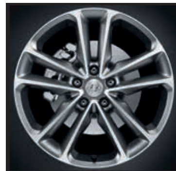
19" kola z lehké slitiny