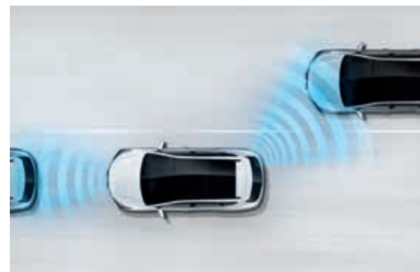
Sledování mrtvého úhlu BSD (Blind Spot Detection). Senzory umístěné vzadu na bocích vozu detekují blízkost vozidla v zóně mrtvého úhlu a aktivují výstražné světlo ve vnějším zpětném zrcátku i akustické upozornění po zapnutí ukazatele směru.