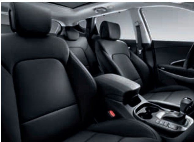
Černý jednotónový interiér